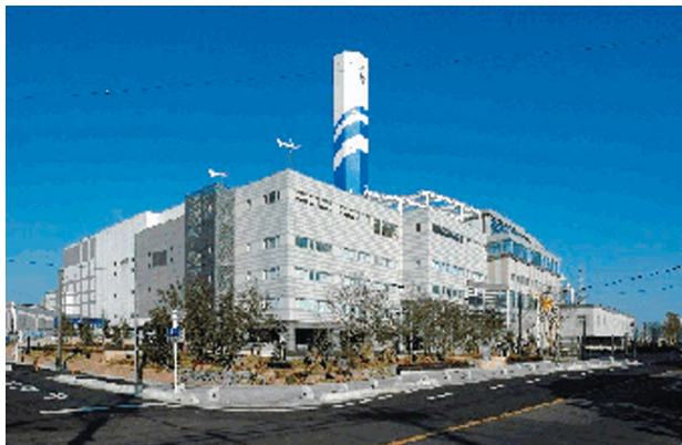
朝日環境センター

Q.施設建設にあたり、地元住民との間で環境保全を目的とした協定書等を結んでいるんですか？