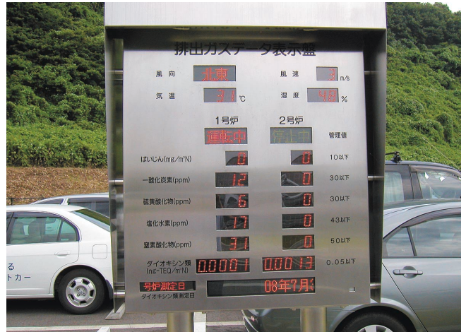
排ガス監視表示板